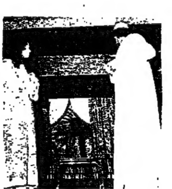
هنا ويحيى في قلعوي عيونى